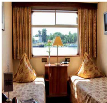
Cabina (12,5 m²)

Categoría fluvial: Año de construcción: 1996 Última renovación: 2006 Eslora: 101,40 m Manga: 11,40 m Calado: 1,30 m Motores: 1500 hp Camarotes: 61 Tripulación/Pasajeros: 31/123 Voltaje: 220 V Bandera: Suiza